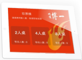
取號APP (可自訂其顯示畫面)

NDS-320A 提供免費的「取號機 APP (支援 iOS、Android 系統)」，讓行動裝置立即變成專業取號設備；不需再採購貴森森的觸控取號器，改用廉價的 Android 平板，能大幅降低叫號系統建成本。