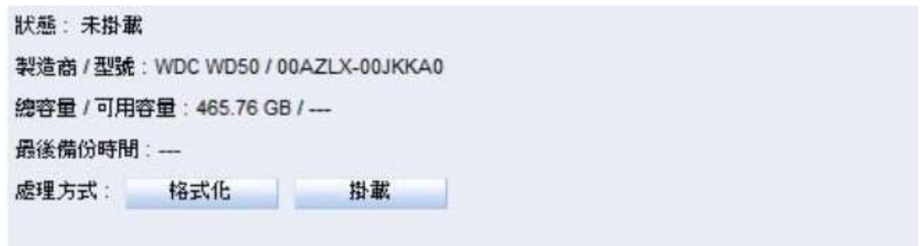
圖 18-1 偵測到 USB 儲存裝置