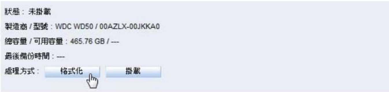
圖 18-2 格式化 USB 儲存裝置