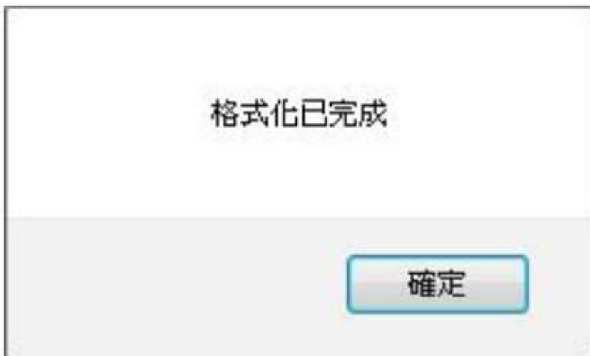
圖 18-4 格式化完成