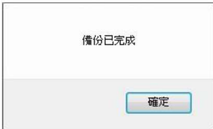
圖 18-9 立即備份完成