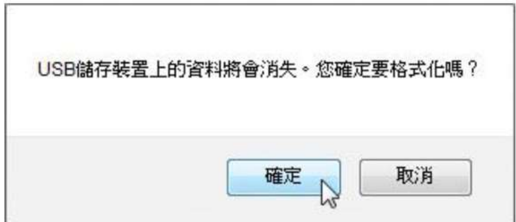
圖 18-3 格式化確認視窗